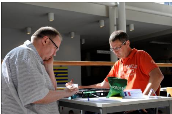
Cogitations intenses en mode classique