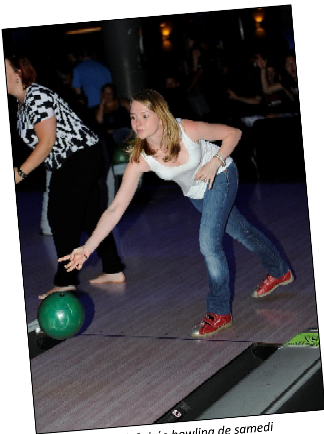
Strike ! Soirée bowling de samedi